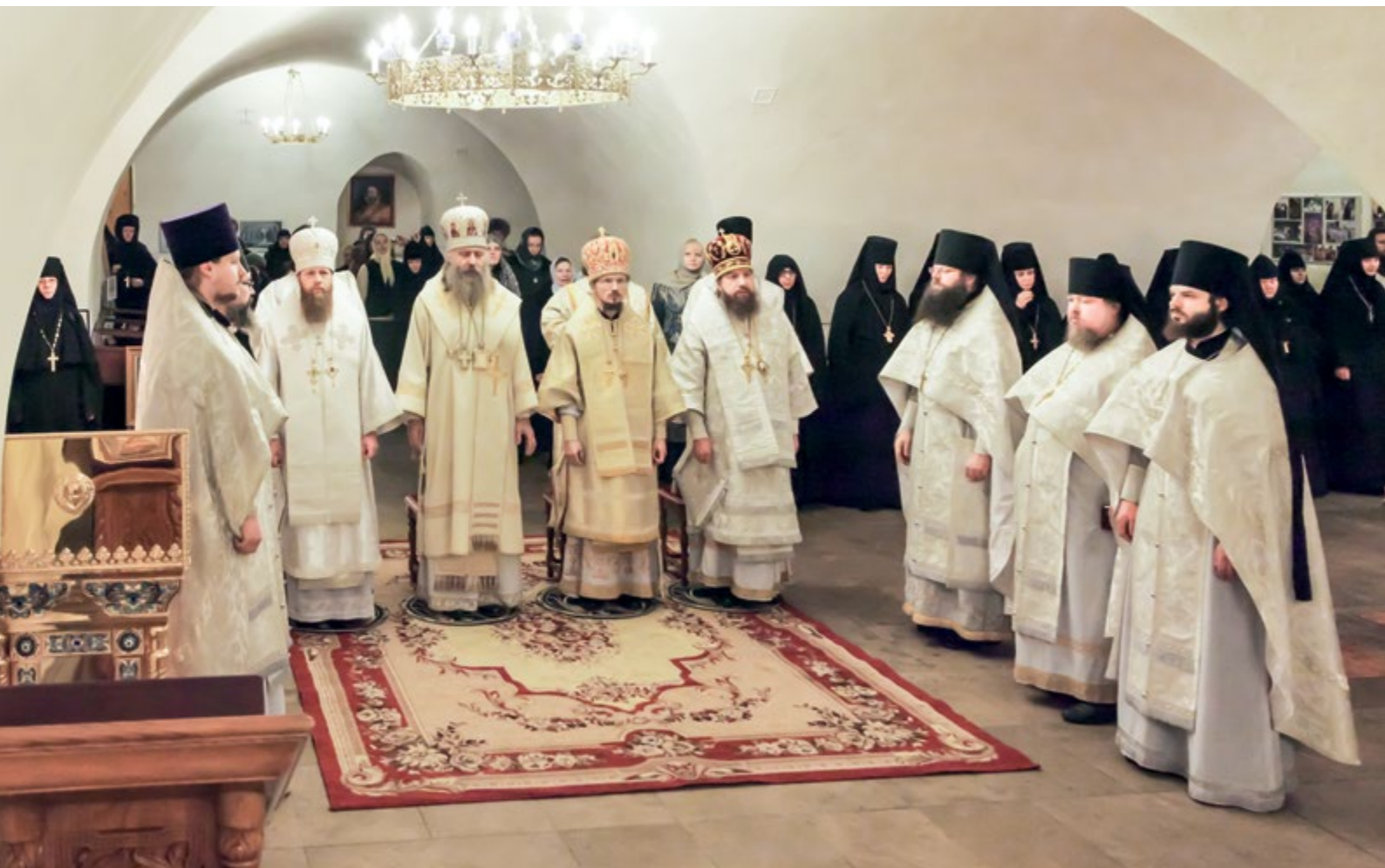
На фото внизу: За Литургией в храме в честь святого преподобного Романа Сладкопевца. Новоспасский ставропигиальный монастырь в городе Москве, 26 января 2016 г.