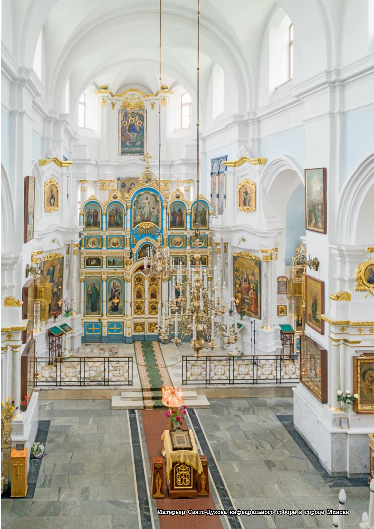
Интерьер Свято-Духова кафедрального собора в городе Минске