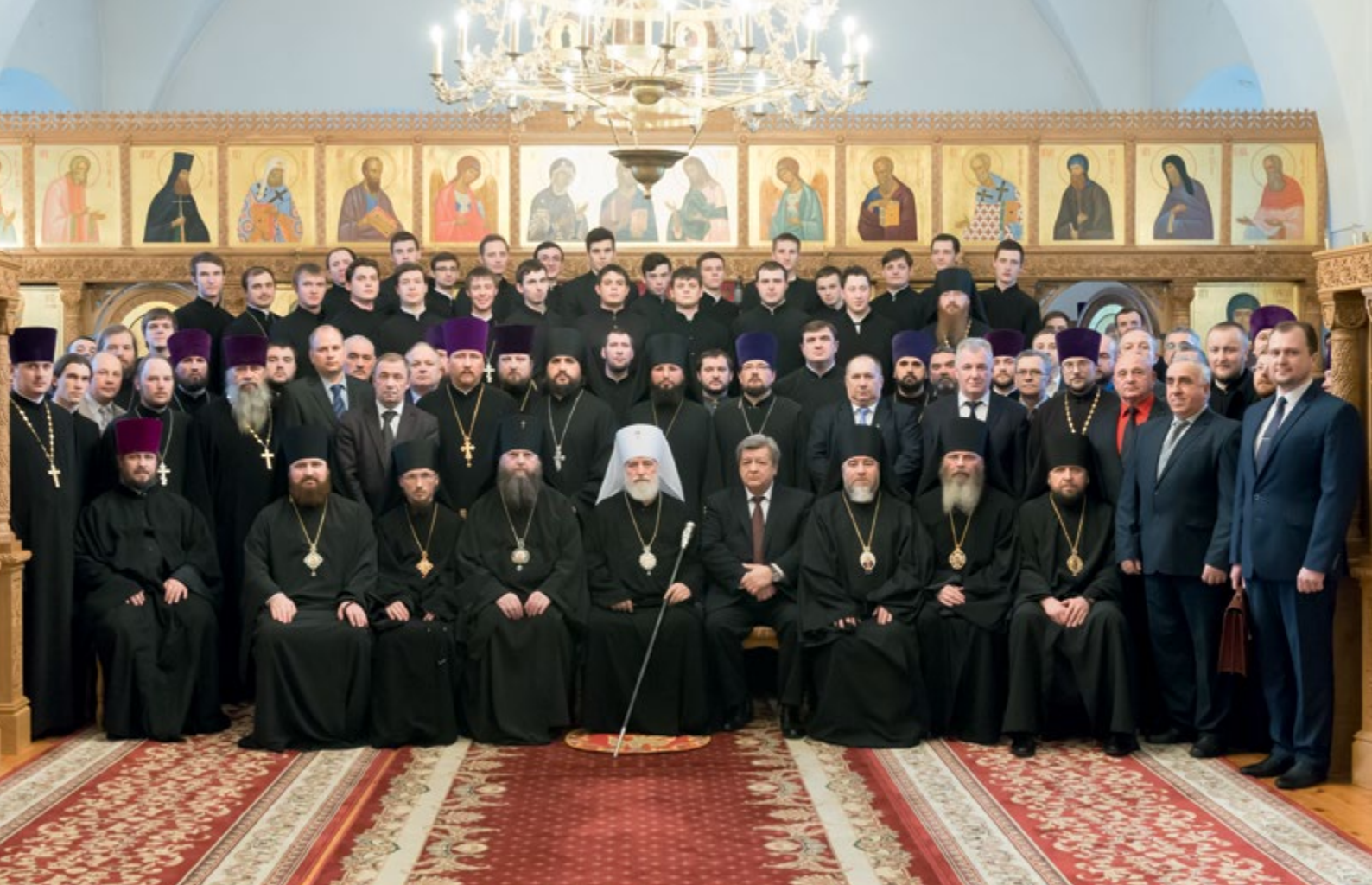
На фото сверху: Общее фото по окончании Актового дня Минской духовной семинарии. Храм в честь Трех святителей МинДС, 12 февраля 2016 г.