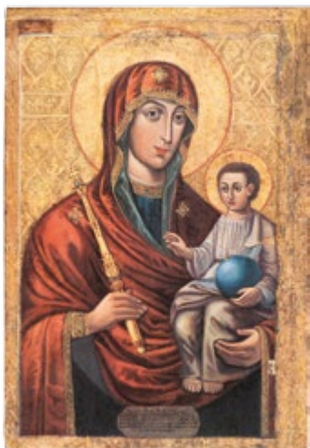
Икона Божией Матери «Минская» 13/26 АВГУСТА

Издаётся по благословению Высокопреосвященного Павла, митрополита Минского и Заславского, Патриаршего Экзарха всея Беларуси