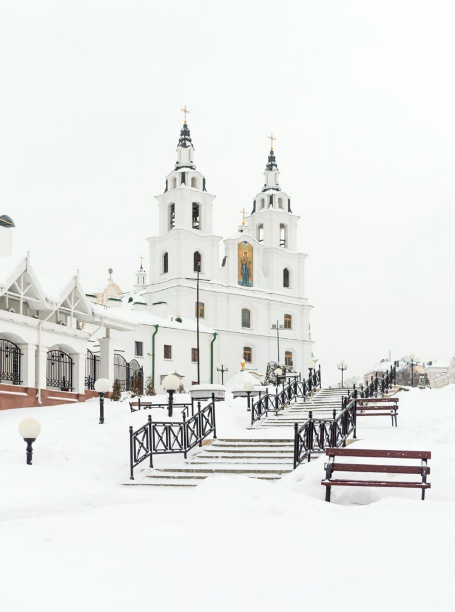
Свято-Духов кафедральный собор в городе Минске